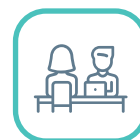
Tertiaire non marchand

De même, la proportion d'emplois dans le secteur tertiaire marchand est inférieure à la moyenne régionale (commerce, transport-entrepasage, hôtellerie-restauration...). Les secteurs tertiaires marchands qui emploient le plus d'actifs sont le Commerce, les Activités de services administratifs et de soutien (dont l'intérim, en particulier pour l'industrie), les Activités juridiques, comptables, de gestion, d'architecture, d'ingénierie, de contrôle et d'analyses techniques (dont des bureaux d'études au service de l'industrie) et le Transport-entrepasage. Les Activités de services administratifs et de soutien et les Activités juridiques, comptables, de gestion, d'architecture, d'ingénierie, de contrôle et d'analyses techniques sont davantage présentes dans le CLPE qu'en BFC, en lien avec la spécificité industrielle du territoire (intérim et bureaux d'études classés dans ces secteurs tertiaires marchands).